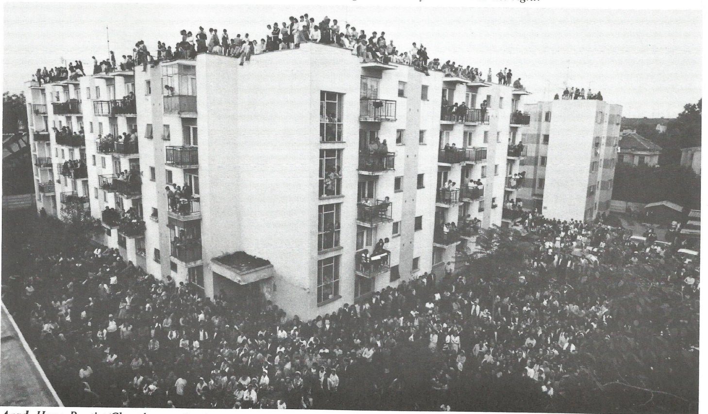
Arad. Hope Baptist Church seats 950 but managed to jam nearly 2500 inside the building. This left 50,000 outside scattered over a 4 block area on roofs, balconies, and in the streets to hear Mr. Graham's message by loud speakers that had been strung on poles, in trees and on roof tops.