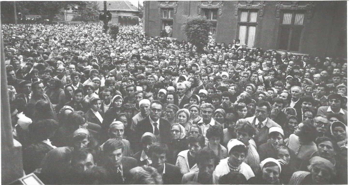
Nagyvárád — Oradea. The Second Baptist Church had removed the pews so more people (4000) could stand inside and 50,000 were outside in the streets listening to loud speakers.