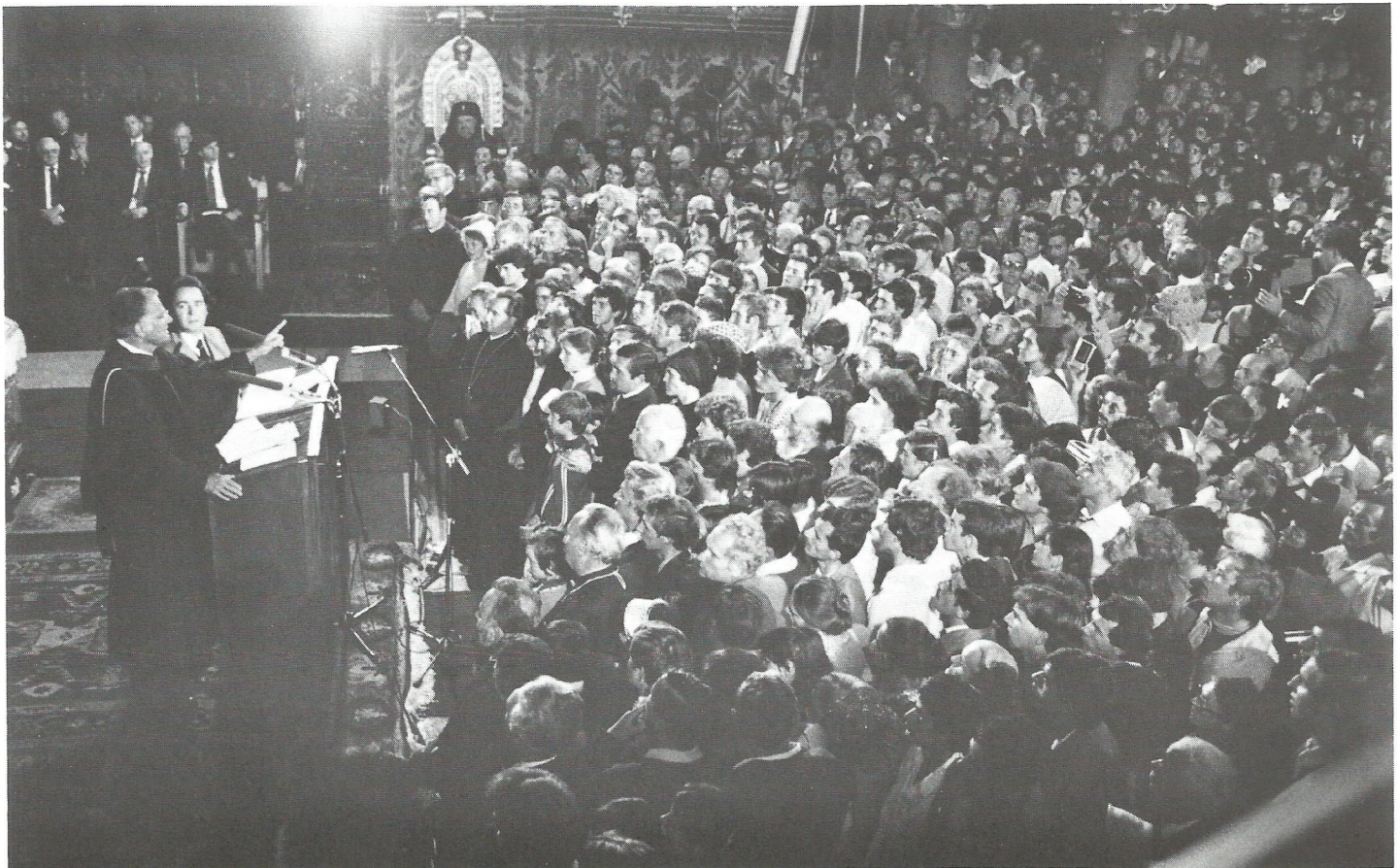
Nagyszeben — Sibiu. Billy Graham preached (through an interpreter) to packed and overflow churches at every stop during his September (1985) tour of Romania. Preaching 11 sermons, in 7 different cities during his 11 day trip, and covering over 1000 miles by plane and car proved to be exhausting. Well over 150,000 turned out to pack the churches and fill streets and yards for blocks around. Most were able to hear the message as loud speakers were placed on buildings and hung on poles and in trees at most meetings.