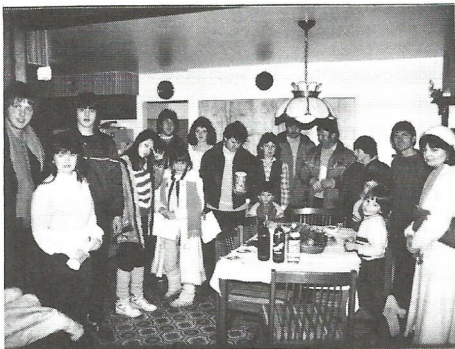
Kántálók Szin testvérénél — Krónikás —

A kántálók ezen különleges missziójával olyan magyar családokhoz is eljutottak, akikkel csak ritkán találkozunk.