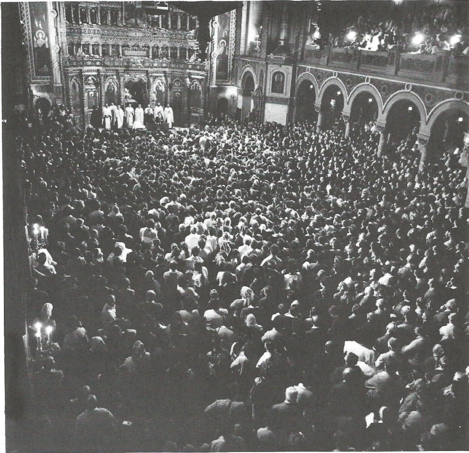
Temesvár — Timisoara. The Orthodox Cathedral was bulging with 6000 inside and 150,000 in the plaza outside.