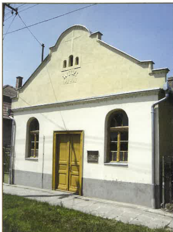
A tatarozás előtti homlokzat – épült 1927-ben.